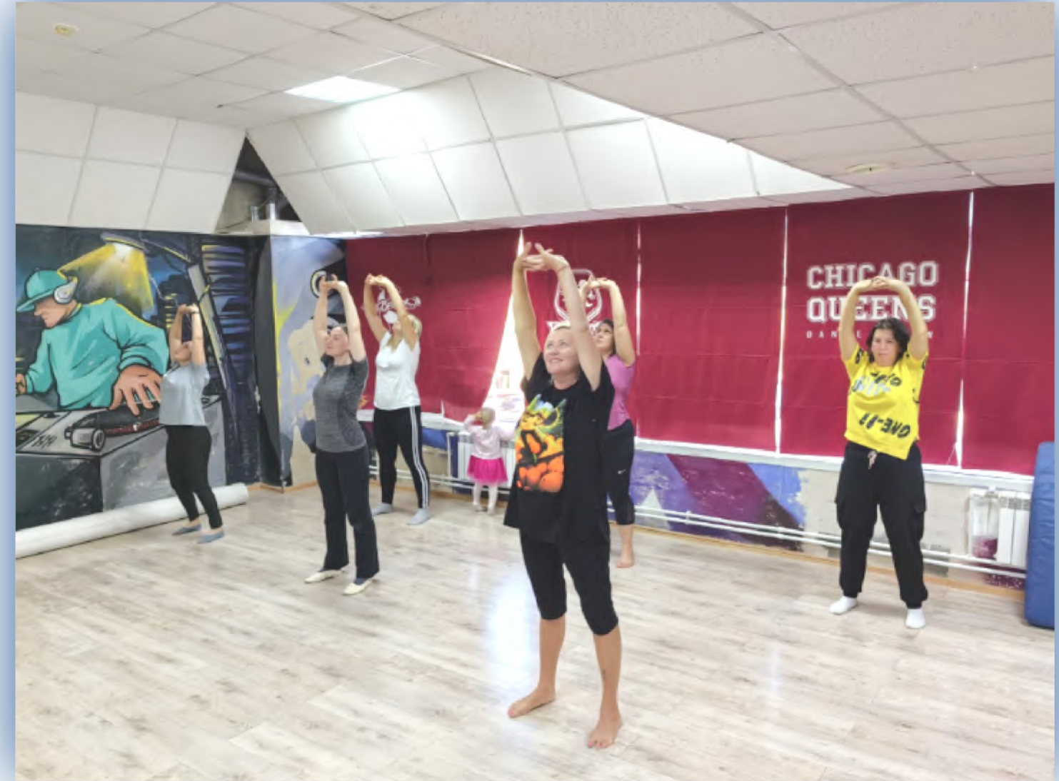
2. Родители подростков-инвалидов старше 10 лет и молодых инвалидов до 30 лет, проживающие в Челябинске