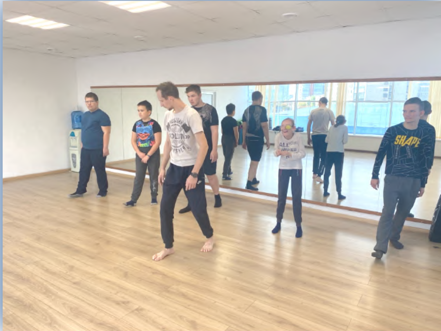
1. Подростки-инвалиды старше 10 лет и молодые инвалиды до 30 лет, проживающие в Челябинске